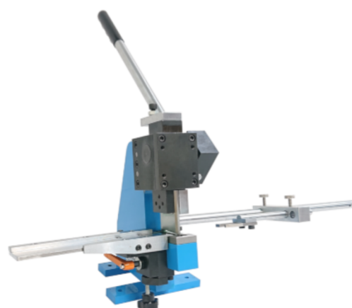
Coupoir Double becs NC3